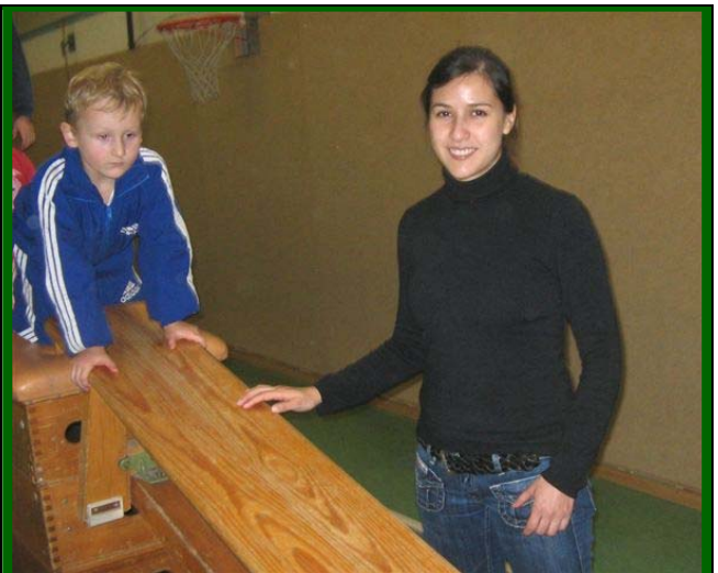
...und im Einsatz.